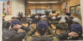
De leerlingen spelen in Groningen het spel Helmsje Op Helmsje Af.